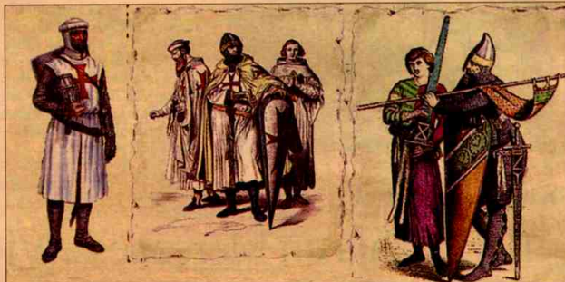
La Orden del Temple constituyó una de las órdenes militares más importantes de la Edad Media.